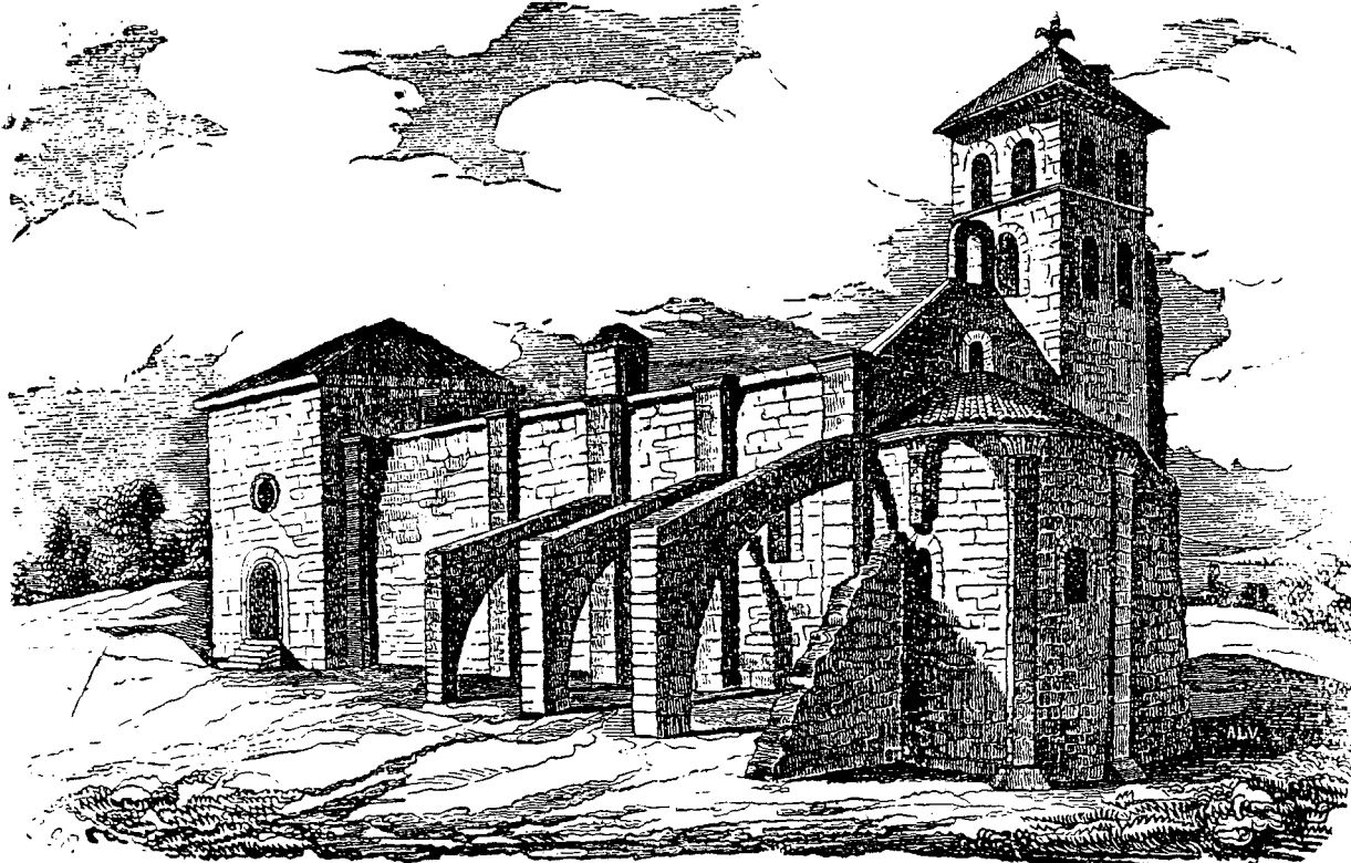
La iglesia de los Templarios, en Ceinos.